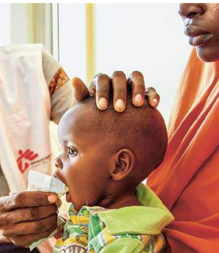
Versorgung eines mangelernährten Kindes mit therapeutischer Fertignahrung