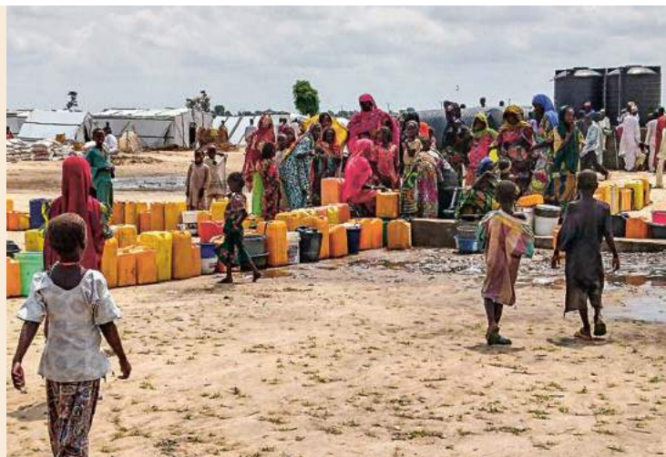
Vertriebenenlager Muna in der Stadt Maiduguri