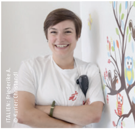
ITALIEN: Friederike A.